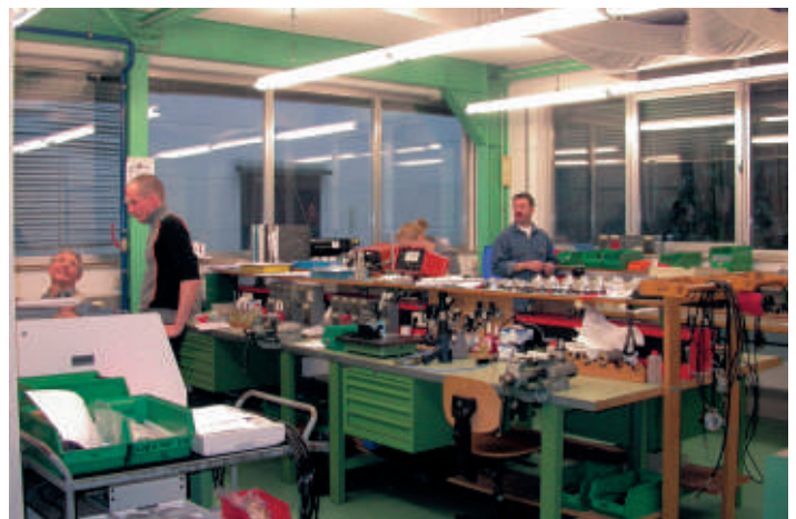
Firma Precise , Leichlingen

Geschäftsführer daran, die Anzahl der Dachmodule